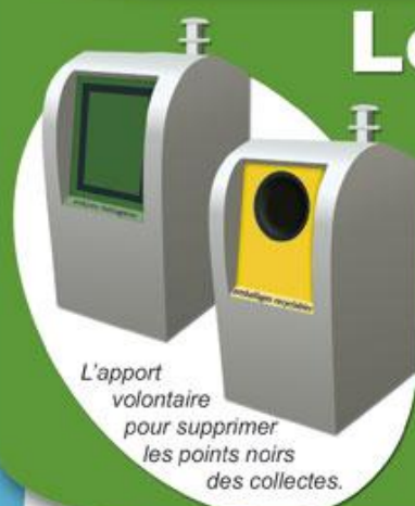
L'apport volontaire pour supprimer les points noirs des collectes.

À partir de 2013, le SIEED va installer sur certaines communes volontaires de nouveaux conteneurs enterrés pour collecter les ordures ménagères et les emballages recyclables. Ce projet n'a pas pour but de remplacer toutes les poubelles individuelles du SIEED, mais seulement de supprimer "les points noirs de collectes" où la circulation des camions est dangereuse voire impossible. Les habitations concernées seront par exemple celles qui sont situées dans des rues étroites, des impasses sans demi-tour, des rues sans trottoirs ou non goudronnées... De nouveaux lotissements en construction (Maulette, Orvilliers, Houdan...) et certains centres-villes bénéficieront également de ce nouveau mode de collecte. Pour leurs habitants, finie la corvée de sortir les poubelles, et vivent les trottoirs enfin rendus aux piétons et aux poussettes !