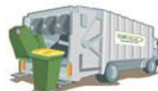
Les camions "bi-compartmentés" vont être remplacés par deux camions distincts

Depuis 7 ans, les volumes de déchets recyclables ont fortement augmenté, et le compartiment qui leur était réservé dans nos camions « bi-compartmentés » est devenu trop petit. Il faut donc chaque jour effectuer de nombreux allers-retours au pôle environnemental de Thiverval-Grignon pour aller vider des camions seulement à moitié pleins. Le nouveau marché permet de changer les camions et les tournées afin d'optimiser le remplissage et les moyens humains et de maîtriser les coûts.