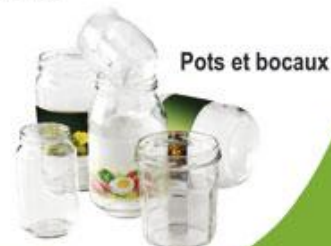
Pots et bocaux